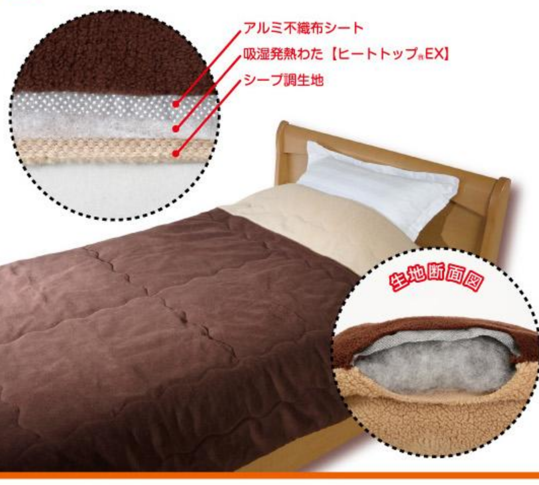
吸湿発熱わた【ヒートトップ®EX】吸湿発熱性の比較データ