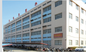
1 栖霞茉莉华服装有限公司