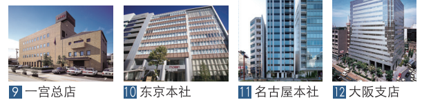
9 一宫总店 10 东京本社 11 名古屋本社 12 大阪支店