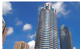
6 上海茉莉林纺织品有限公司