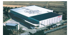
MORIRIN物流株式会社筑波中心