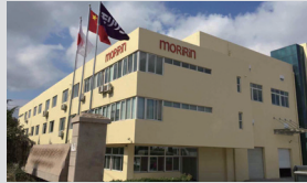
4 上海茉莉林纺织品有限公司 青岛分公司