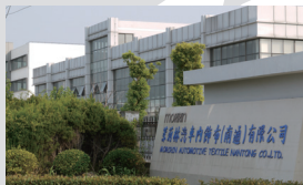
5 茉莉林汽车内饰布(南通)有限公司